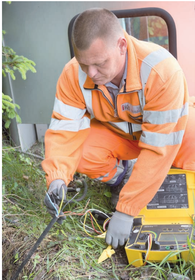
Bei der elektrotechnischen Messung werden alle Installationen nach gültigen Vorschriften geprüft.

Im Herbst 2011 fanden ausführliche Beratungsgespräche statt. Daraufhin beauftragte die Gemeinde Mutters die IKB mit der Feinanalyse, die auch eine Kabelnetz-Analyse einschloss. Die IKB-Lichtprofis erstellten ein maßgeschneidertes Beleuchtungs-Gesamtkonzept. Im November 2011 beschloss der Gemeinderat die Beleuchtungs-Umstellung. Dabei fiel die Wahl auf das Modell Futurlux Head 2 und 3 der Tiroler Firma Swarco mit 34 bzw. 46 Watt. Nach der Auftragsvergabe im Dezember 2011 bestellte die IKB Leuchten, Masten und Kabelübergangskästen. Witte-rungsbedingt wurde dann im Mai 2012 mit der Erneuerung der Beleuchtung begonnen. Mitte Juni wird Mutters im neuen LED-Licht erstrahlen.