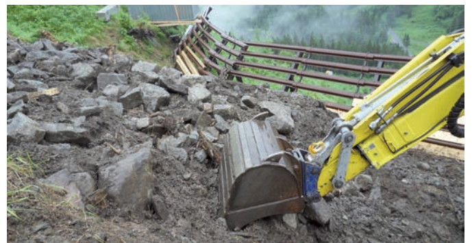
Detailprojekt: Detailplanung der Lösung aus Vorprojekt / Regionalstudie, Einreichung, Umsetzung.

lichen Vorstudien auch eine zeitnahe Ermittlung von Lösungen bei einer gleichzeitigen Dringlichkeitsreihung für Schutz-/Sanierungsmaßnahmen. Gekoppelt mit einer Kosten-Nutzen-Untersuchung bilden sie eine solide Grundlage für weitere