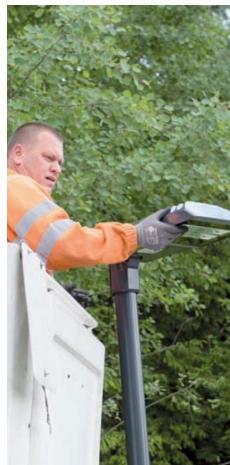
Die Swarco-LED-Lampen sparen Betriebskosten.